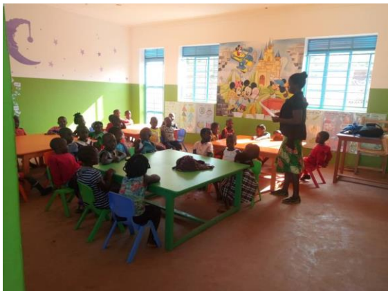
Onze kinderen in de nieuwe kleuterklas

Ieder klaslokaal zal binnenwerks 48 m 2 zijn. De muren zullen worden gestukt en geschilderd, zowel aan de binnenkant als aan de buitenkant. De binnenkant en de buitenkant zullen met vrolijke tafelen worden beschilderd.