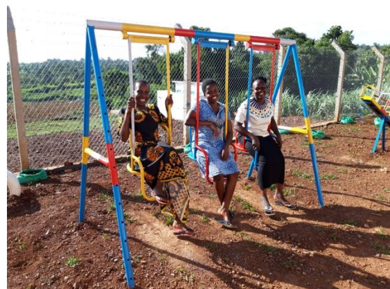
De drie onderwijzeressen