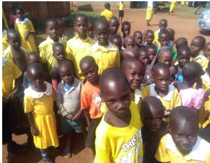
Kinderen van de basisschool

We weten inmiddels dat ouders hun kinderen alleen naar school sturen als zij overtuigd zijn van de kwaliteit van onderwijs en dat dit bijdraagt aan een goede toekomst voor hun kinderen. Met uw hulp wil Stichting Moving On de lokale gemeenschap in Kabowa voorzien van goed onderwijs in een duurzaam gebouw, uitgerust met een goede infrastructuur en een mooie en kindvriendelijke afwerking. De verwachting is dat hierdoor met sponsoring van één klaslokaal minimaal jaarlijks 50 kinderen naar school kunnen gaan.