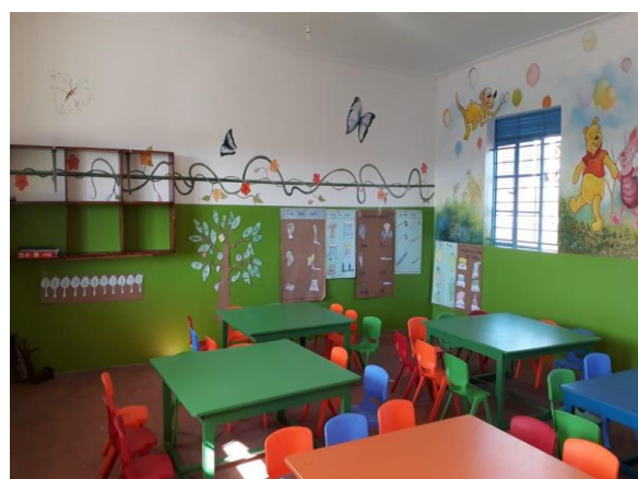
Vrolijke inrichting kleuterklas